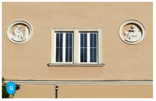
Rechts: In welcher Straße steht das Haus, an dem diese Verzierungen zu entdecken sind? Der Standpunkt der Fotografin war aber in einer anderen Straße.