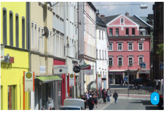
Rechts: In welcher Straße fuhr der Doppeldeckerbus, aus dem die Fotografin diese Aufnahme machte?