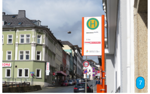
Rechts: Sicher erkennen Sie, welche Straße dieses Bild zeigt. Wissen Sie auch, wie der Name der Bushaltestelle lautet?