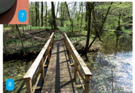
Rechts: Unscheinbare Insel in einem Teich, doch lange Geschichte. Die Turmhügelanlage wurde bereits 1503 niedergebrannt. Wo?