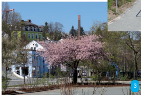
Oben: Welche Straße verläuft zwischen dem blühenden Baum und dem blauen Gebäude?