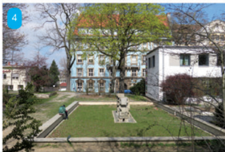
Rechts: Wo entstand diese Aufnahme?