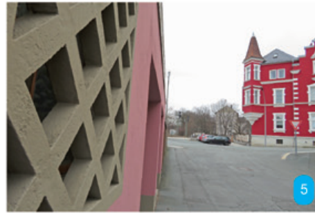
Links: In welcher Straße stand die Fotografin? Unten: Wie heißt diese Straße, die sich nicht gerade in einem guten Zustand befindet?