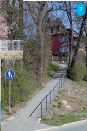
Oben: Von welcher Straße geht dieser Fußweg ab?