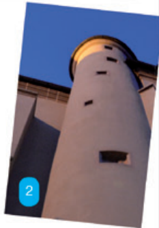
Oben: An welcher Hofer Kirche gibt es den sog. Schnecken-turm? TIPP: Mit ihm erreichte man die Türmer-Wohnung, ohne die Kirche zu betreten.