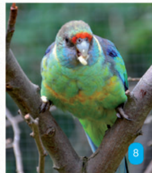
Links: Wo in Hof gelangen Fotos von Vögeln ohne störende Gitter im Vordergrund?