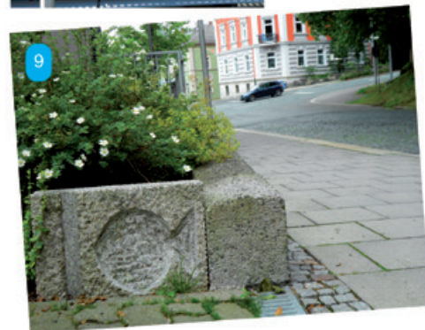
Rechts: Wie heißt die Straße im Hintergrund, in der das Auto vorbeifährt? TIPP: Der Fisch weist auf ein christliches Symbol hin und damit auf eine in der Nähe befindliche Kirche.