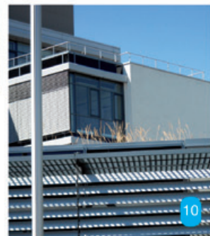
Links: Getreide auf dem Dach wächst beim Bayerischen Landesamt für ... ?