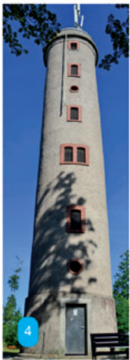
Links: Rapunzel hätte ihre helle Freude an diesem 22 m hohen Aussichtsturm im Landkreis Hof. 1498 als Wartturm aus Holz gebaut, wurde an der gleichen Stelle 1895 dieser aus Stein errichtet. In welcher Stadt im Landkreis?