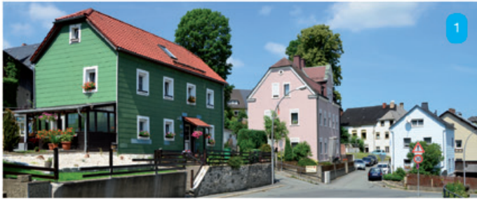
Oben: In welchem Eck von Hof befinden wir uns, wie heißt der Stadtteil?