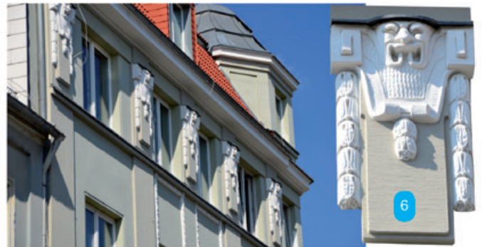
Oben: Sind Ihnen - vielleicht beim Warten auf den Bus - schon einmal diese Verzierungen aufgefallen? In welcher Straße steht dieses Haus? TIPP: In der Nähe wird ein Brunnen wieder zum Plätschern gebracht.