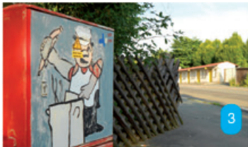
Links: Was befindet sich rechts dieses originell bemalten Verteilerkastens? Auf dem Foto erkennt man das dazugehörige Kassenhaus.