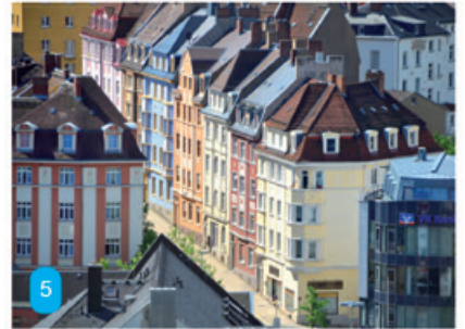
Rechts: Wie heißt die Straße, die hier aus einer ungewöhnlichen Perspektive zu sehen ist? Übrigens, die Häuserreihe aus einem „Guss“ ist von einem einzigen Architekten um 1900 erbaut worden.