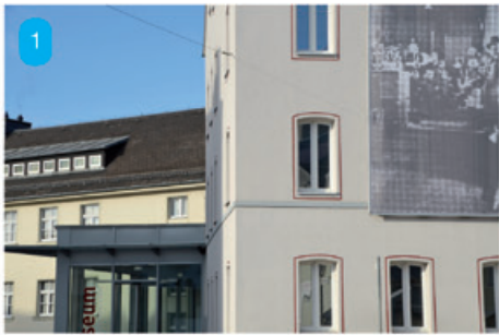
Links: In welcher Straße finden wir diese Gebäude?

Rechts: In welcher Straße steht dieses Gebäude? TIPP: Es ist eine Schule und wurde von einer anderen Straße aus fotografiert.