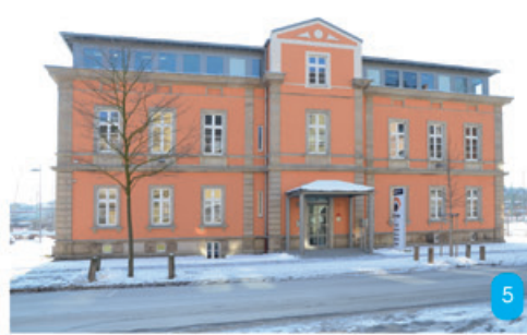
Links: In welcher Straße befindet sich dieses schmucke, denkmal- geschützte Haus, das 1925 erbaut wurde?

Rechts: Ein Hofer Künstler hat den „Visionär“, eine drei Meter hohe Skulptur, geschaffen. Der Kreis- verkehr zusammen mit dem Kunstobjekt entstand 2005. In dem Weiß des Betons und dem Grün des Rasens spiegeln sich die Stadtfarben wieder. Um welche Stadt handelt es sich?