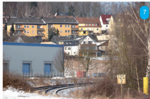
Links: Auf den Hang wel- chen bewaldeten Hügels blicken wir hier? TIPP: Es ist kein offizieller Stadtteil von Hof.

Rechts: Normalerweise sieht man sich hier nicht die Decke an, son- dern genießt die Aussicht. In welchem Park?