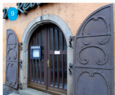
Links: In welcher Straße kann man dieses Tor entdecken? Übrigens, das Tor (18. Jahrhundert) ist wie bei vielen anderen Häusern der Innenstadt älter als das Haus (1909).

Rechts: Wie viele Turmuhren befinden sich an der Marienkirche?